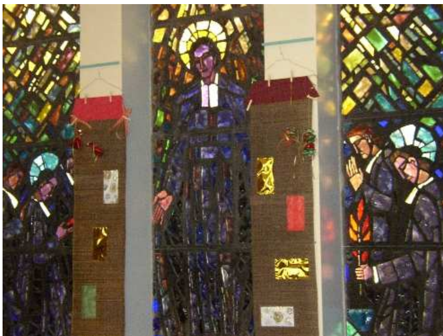
Figure 1 : St Jean-Baptiste de La Salle et les premiers Frères