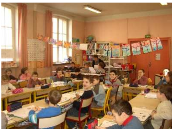
Figure 3 : En cours d'Anglais