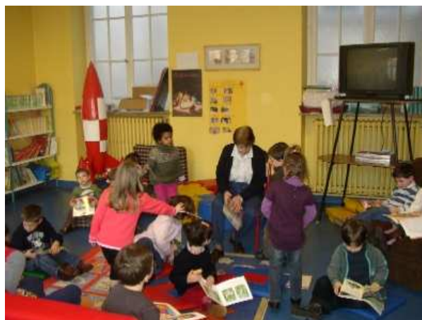
Figure 4 : En Bibliothèque