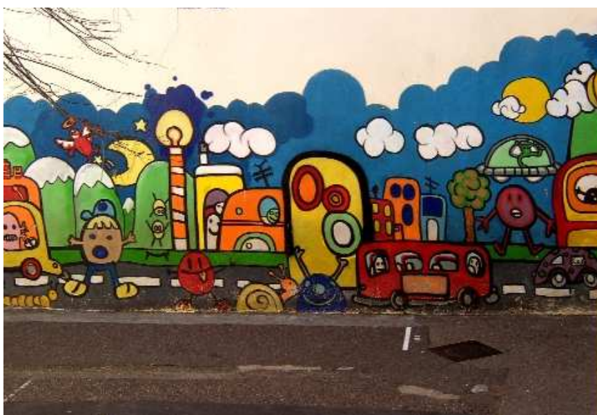
Figure 2 : La Fresque